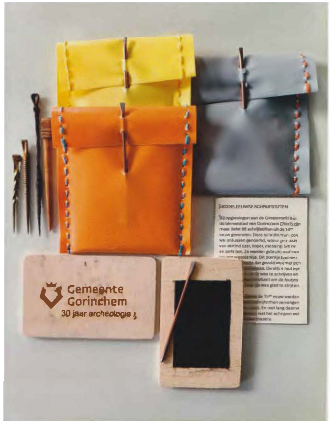
Afb. 1 De replica's.

Om aandacht te schenken aan 30 jaar archeologie in de gemeente Gorinchem hadden de medewerkers van het depot voor de jonge bezoekers replica's gemaakt: een wasplankje met zwarte was in een uitholling en een schrijfstift met een afgeplat uiteinde in een etuitje.