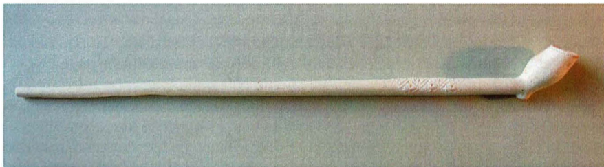
Afb. 2 De complete Gorcumse pijp van Willem Teeck, ca.1650/1660 met vlekje glazuur rechtsboven op de kop.

Bij thuiskomst eerst in het boek 'Tabaksnijverheid in Gorinchem' gekeken 1 en inderdaad: een 17 e eeuwse product uit Gorinchem. Een jongere pijp eveneens uit Gorinchem van Christiaan Wouters met een fraaie zijmerkversiering vond ik in 2012 in Tuil tegenover Zaltbommel. 2 De door Willem (William) Teeck gemaakte pijp is van omstreeks 1650/1660. Hij was een uitgeweken Engelsman die in ca. 1593 is geboren. Zoals bekend waren de eerste pijpenmakers in Europa de Engelsen, die begin 17 e eeuw naar Amsterdam vertrokken, veelal protestanten op