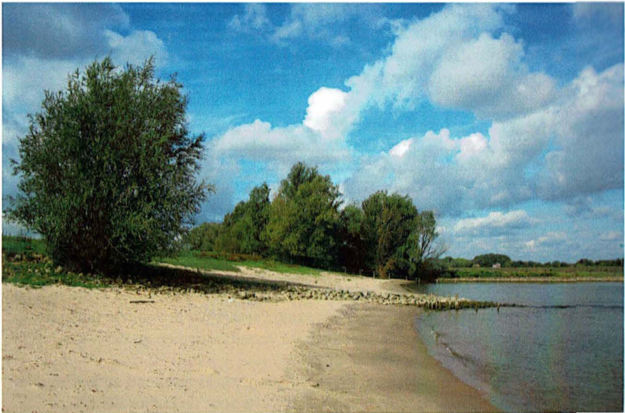
Afb. 1 Oever Hurwenen in de voorzomer van 2011. Er komt hier nog een natuurlijke opslag voor van wilg, zwarte populier, walnoot en vaak rijen wilgen die uit zaad precies in de hoogwaterlijn gaan groeien, zoals in vroeger eeuwen.

Ik vind het heerlijk om de rivieroeveren af te struinen, en dan niet meer in de directe omgeving aan de Merwede, maar verder van huis. Aan de dynamische Waal bijvoorbeeld, waar nog flinke einden gelopen kunnen worden .