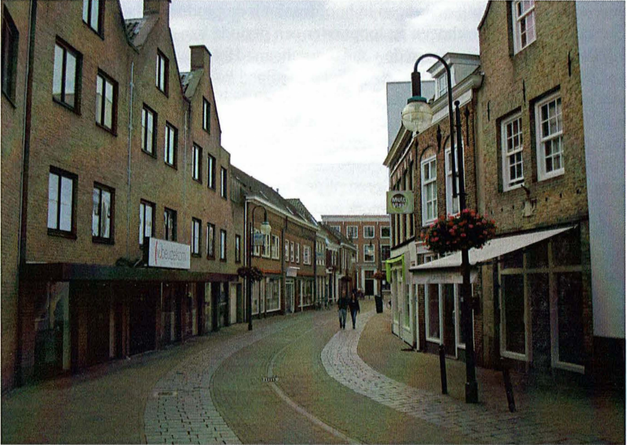
Afb. 4 De Gorcumse Kwekelstraat anno 2014 waar Willem Teeck in 1638 een huis kocht genaamd 'De Vijf Maagden' en er een pijpenmakerij begon. Er is niet veel meer over van een paar eeuwen geleden.