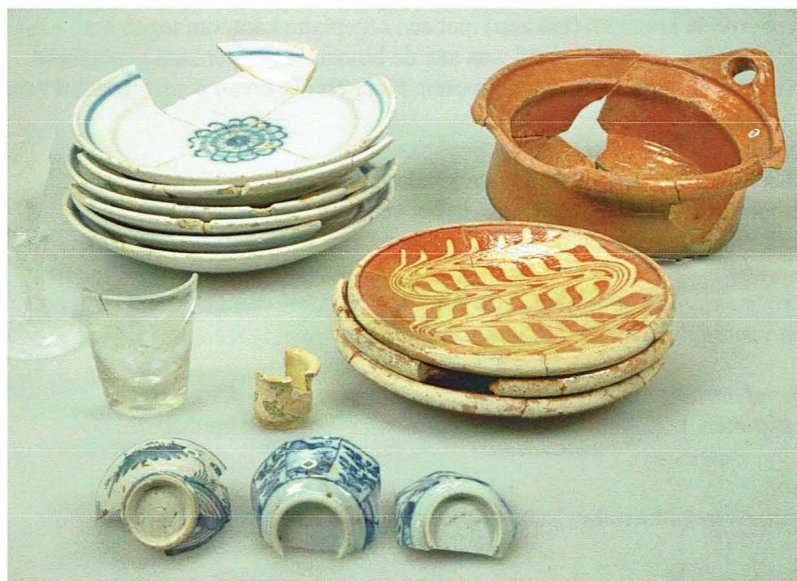
Afb. 33 De toevalsvondst van de Arkelse Onderweg.

De werkgroep archeologie van de gemeente Gorinchem werd in de gelegenheid