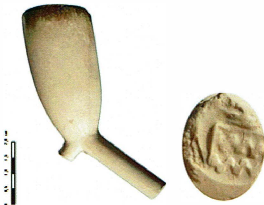
Afb. 34 Pijp met wapen van Arkel gekroond.

Jan van Oostveen maakte een rapportage van de bijna 200 pijpen. Hiervan was 77% gebakken in Gorinchem, uit Gouda kwam 23 %. De Goudse tabakspijpenmaker Jan Cabouw merkte zijn pijpen met het wapen van Arkel/Gorinchem en was daardoor populair in Gorinchem. De tabakspijpen werden gedateerd tussen 1725 -1745. Dit is een goede indicatie voor de datering van deze toevalsvondst als geheel.