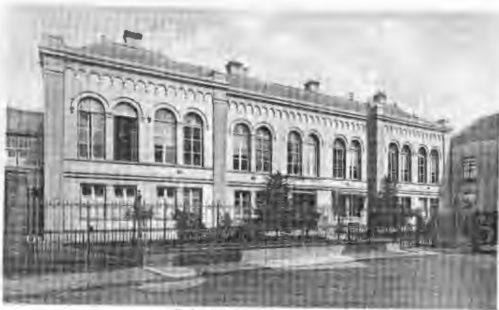
Ziekenhuis – Gorinchem.