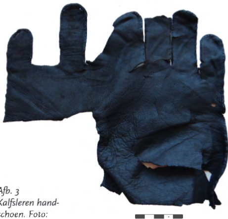
Afb. 3 Kalfsleren hand- schoen.

voorwerpen te maken hadden met de rosmolen. De twee voorwerpen, die geen directe parallellen kennen, kunnen specifiek voor het gebruik in de rosmolen gemaakt zijn. Zo is bijvoorbeeld bekend dat in schepen leer gebruikt werd om de lijnen te beschermen tegen slijtage door wrijving. Een nieuwe interpretatie is dat de voorwerpen onderdeel zijn van het paardentuig of de tuigage van de rosmolen. Door de smalle compartimenten zou mogelijk touw of een stok hebben gelopen. Het grote voorwerp vertoont gebruikssporen die erop duiden dat het voorwerp iets is krom gebogen, mogelijk door touw. De voorwerpen zouden daarom inderdaad deel kunnen hebben uitgemaakt van paardentuig, bijvoorbeeld een gareel of voor de bescherming van de touwen die het gareel en de balk van de molen verbinden (afb. 2). Er zijn tot nu toe geen vergelijkbare voorwerpen opgegraven.