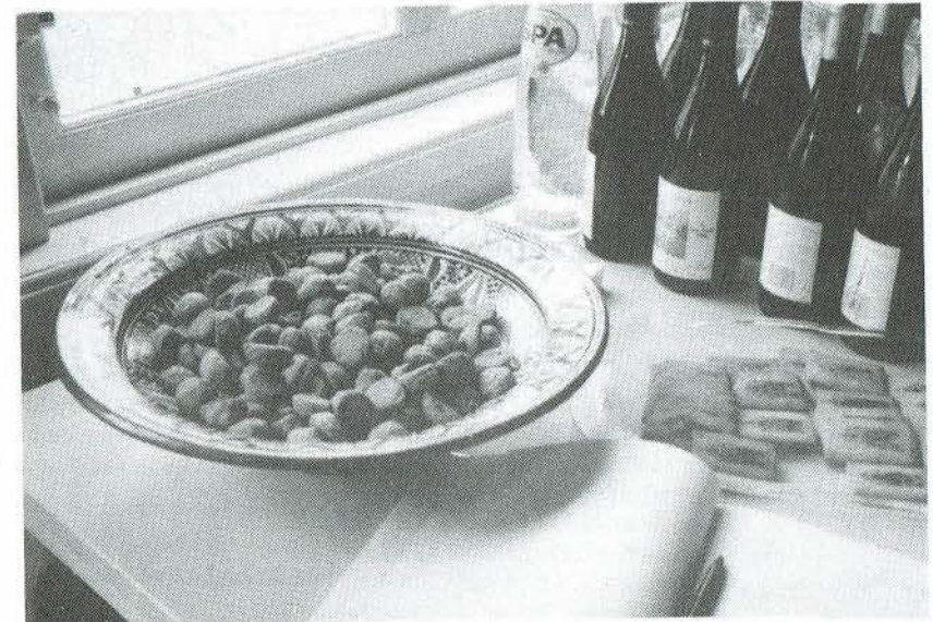
Gorkumse zoute bollen, versgebakken gelegenheidskoekjes en feestdranken staan te wachten tot de openingswoorden zijn uitgesproken.