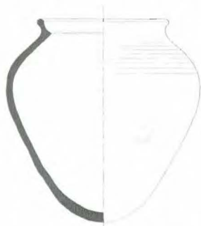
Afb. 1 Aspot uit Arkel, (rand gereconstrueerd), schaal 1 : 4 tekening T. Koorevaar

Tijdens mijn speurtochten in de jaren zeventig naar archeologisch materiaal in de omgeving van Arkel, werd ik geconfronteerd met een aardewerken