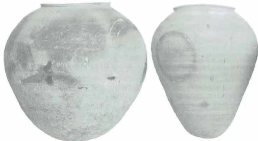
Afb. 4a, b en c De aspotten uit Arkel en Gorinchem

Bij de kleine potten is zowel de buiten- als de binnenkant geschaafd. De kleine potten hebben aan de binnenkant van de rand een dekselgeul. Bij de grote potten is de randafwerking aan de bovenkant vlak.