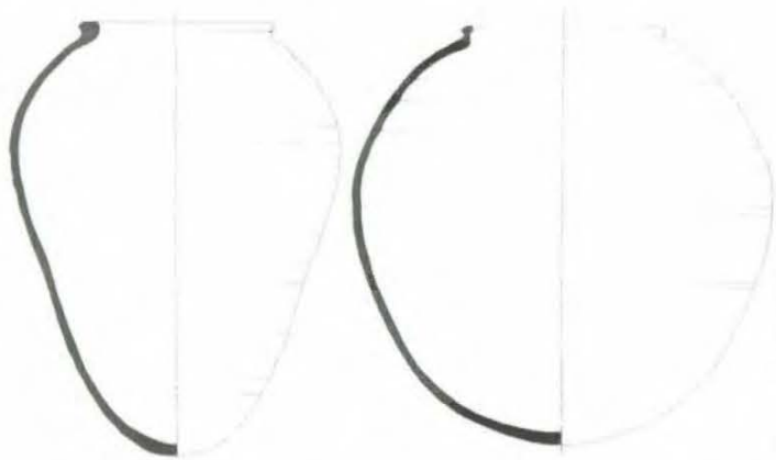
Afb. 3a en 3b De aspotten uit Gorinchem, schaal 1:8, tekening T. Koorevaar

(zie afb. 1). Daarnaast zijn er de grotere kogel-eivormige met een hoogte van 40 cm en een breedte van 32 tot 40 cm (afb.3a en 3b).