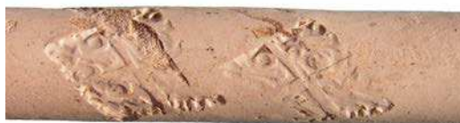
Foto pijp niet op schaal