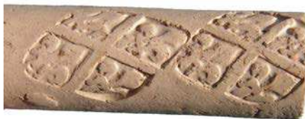
Foto pijp niet op schaal