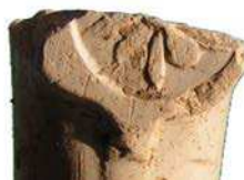
Foto pijp niet op schaal