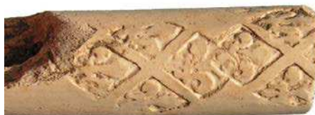
Foto pijp niet op schaal