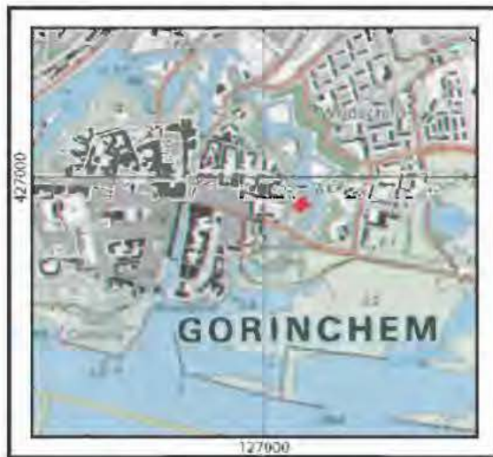
Figuur 1. De locatie bastion IX aan de Dalemwal te Gorinchem

Op 28 oktober 2002 is door de gemeentearcheoloog P. Floore met assistentie van J. Vaars van Hollandia cultuurhistorisch onderzoek en advies, Zaandijk, een archeologische waarneming verricht op het terrein van Bastion IX aan de Dalemwal te Gorinchem (figuur 1). Deze wal vormt samen met de Dalempoort een onderdeel van de in de jaren tachtig van de 16e eeuw als antwoord op de Spaanse dreiging aangelegde vesting van Gorinchem. Omstreeks 1600 was de vesting Gorinchem geheel aangepast aan de eisen van de toenmalige oorlogvoering en vormde het samen met Loevestein en Woudrichem een belangrijke vestingdriehoek voor de verdediging van Holland. De vesting bleef in gebruik tot in het begin van de 20e eeuw, tot veranderingen in de wijze van oorlogvoering en defensie een einde aan de eeuwenoude militaire betekenis maakten van vestingsteden als Gorinchem.