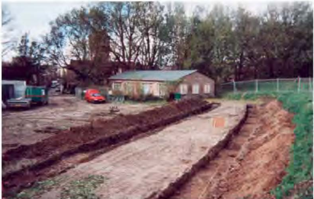
Figuur 5. De onderzochte sleuven op de onderzoekslocatie bastion IX, aan de Dalemwal te Gorinchem, sleut 1 en 2, foto naar het noorden.

1660 en 1690, het overige vondstmateriaal kan geplaatst worden in het laatste kwart van de 17e eeuw. Dit wijst er op dat de wallen in deze periode zijn opgehoogd en de wallen uit de jaren tachtig van de 16e eeuw dus lager geweest moeten zijn. De in de kleilaag zichtbare sporen (figuur 4) bestonden uit kuilen, paalkuilen - vaak met de paalresten er nog in - en uitbraaksleuven, ontstaan bij de sloop van muurwerk. In werkput 2 is een lange noord - zuid lopende muur aangetroffen die waarschijnlijk deel heeft uitgemaakt van het recentelijk gesloopte gebouw van de muziekvereniging. Ook het in werkput 1 geconstateerde oost - west georiënteerde muurtje moet vermoedelijk hieraan worden toegeschreven. De overige gevonden sporen kunnen in de 19e en/of 20e eeuw geplaatst worden, een groot deel zal samenhangen met de bouw en sloop van het verenigingsgebouw. Bij de bouw hiervan is, zoals nu nog zichtbaar is aan de zo ontstane steilkant van het wallichaam, zo'n anderhalve meter klei van de wal afgeschoven. Met deze afgraving en vervolgens de bouw en sloop van het verenigingsgebouw zijn de resten van het kruithuisje evenals andere archeologische sporen volledig verdwenen.