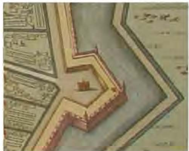
Figuur 2. Detail van bastion IX op stadskaat van Blaeu, ca. 1640

De waarneming richtte zich op twee sleuven die op het terrein van het verdwenen gebouw gegraven waren (figuur 3). Elke sleuf had een lengte van circa 40 meter en een breedte van 1.25 meter. Direct onder de 30 tot 40 centimeter dikke bovenlaag werd de lichtbruine klei van het wallichaam aangetroffen.