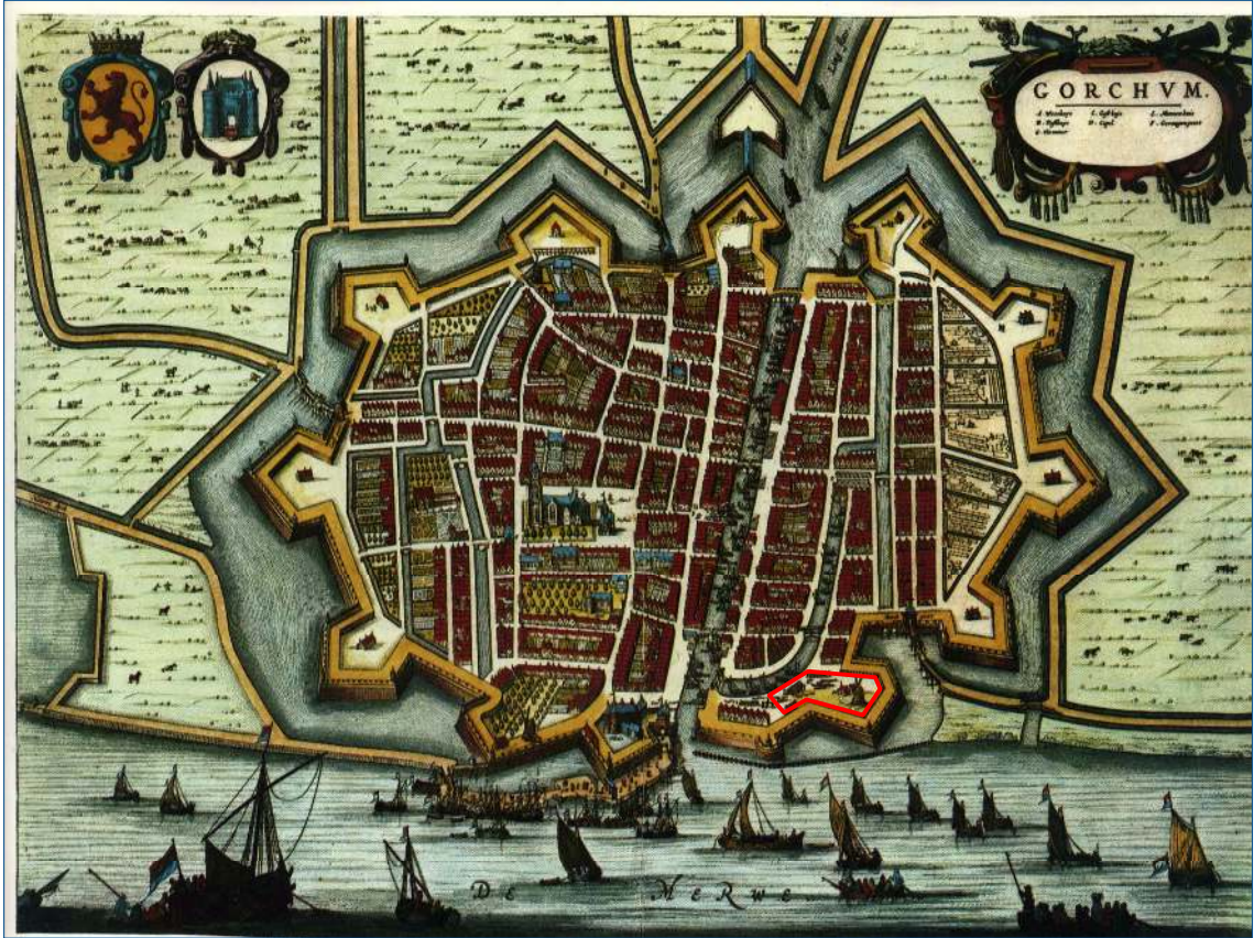
Figuur 3. Globale ligging van het plangebied (rood) geprojecteerd op de kaart van Blaeu uit 1652.