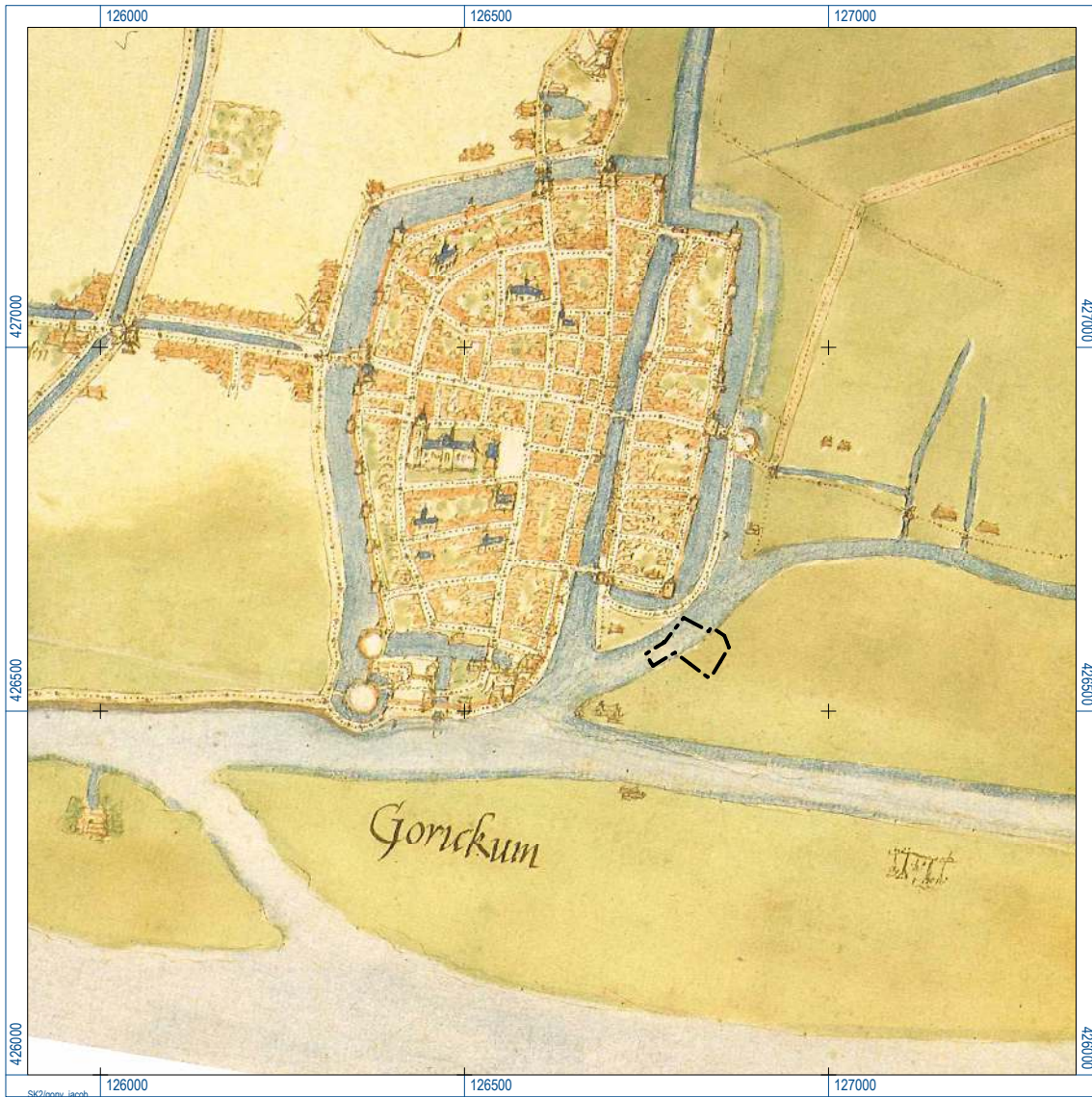
Figuur 2. Projectie van het plangebied (zwart) op de kaart van Jacob van Deventer uit het 3e kwart van de 16e eeuw (bron: Van der Krogt, 1992).