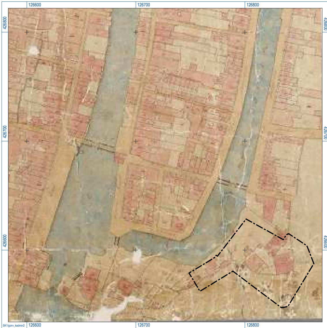
Figuur 4. Projectie van het plangebied (zwart) op de kadastrale minuut uit de periode 1811-1832.